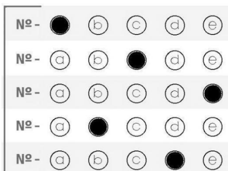
Figura 02 - preenchimento CORRETO de cartão-resposta Ensino Médio